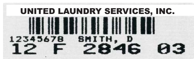
Etiqueta de identificação com código de barras

A impressão feita pela Danvic, seguindo instruções do cliente, é executada em computador e utiliza uma tinta indelével, que suporta muitas lavagens. As etiquetas poderão conter caracteres alfanuméricos, com ou sem código de barras. O código de barras facilita a identificação de cada roupa de forma rápida, através de leitor, para uma eficaz administração de enxovais. Poderão ser controlados, por exemplo: a quantidade de lavagens, o desaparecimento de roupas, a frequência de utilização, etc.