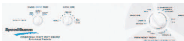
Painel da Secadora